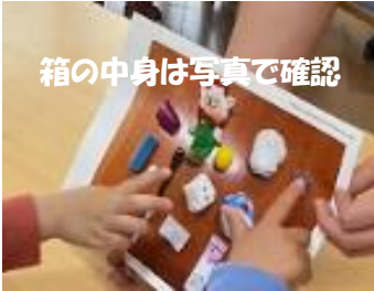
箱の中身は写真で確認

4月、新しいメンバーでスタートし、ぼちぼち増えたな~と思っていたら、なんと20名もの新しいお友だちがみんなの仲間になってくれました。嬉しいです☆ 毎月1回のこの通信、今年度は、「活動・あそびの意味」を掘り下げ、お伝えしていきます。支援計画の内容にもよく書いているワードを盛り込みながら、特に私自身がてのりので紹介したプログラムの中から、発達理解につながる記事を書いていきたいと思ひます。