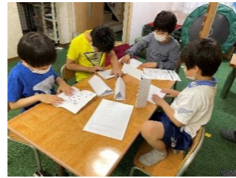
チャレンジ1:柱となる紙を折る