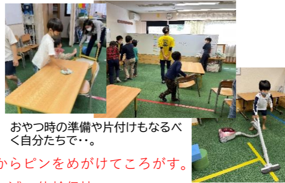
おやつ時の準備や片付けもなるべく自分たちで。。

黄色の50音のサイコロを振り、そのひらがなのつくものを答える→ピンク色の助詞のサイコロを振り出した助詞を使って文章にする。「コアラと一緒にあそんだ。」「ぬりえもたのしい。」「おかあさんはすごいこわいです。」や、「アンパンマンもパン。」など、ユニークな文章も！