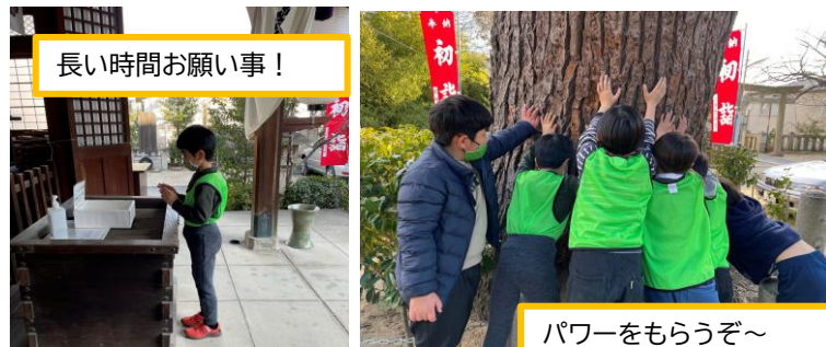
長い時間お願い事！