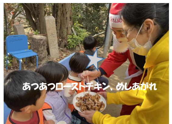
あつあつローストチキン、めしあがれ