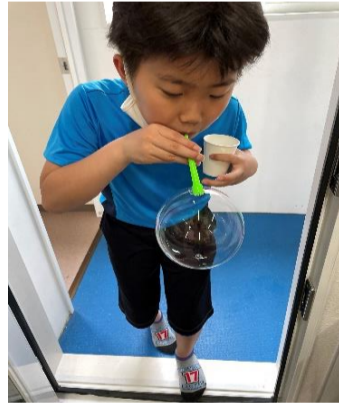
大きいシャボン玉を作るぞ~!!