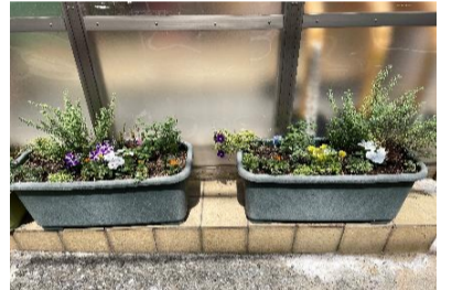
花を植え替えました。