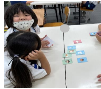
キャプテン・リノ