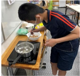
チキンラーメン作り